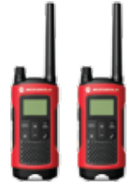
วิทยุสื่อสารรุ่น T246 จำนวน 2 เครื่อง