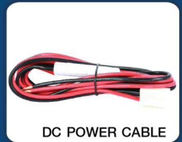
DC POWER CABLE