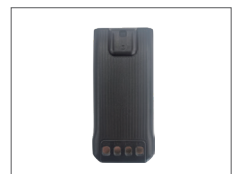
แบตเตอรี่ 2000mAh BL2021