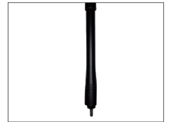
สายอากาศ