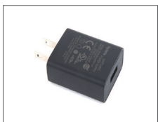
อะแดปเตอร์ (USB)