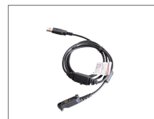
สายโปรแกรม PC155