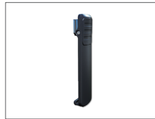
คลิปหนีบเข็มขัด