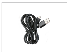
สายตาค้า PC 143