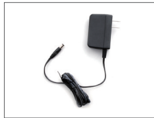
อะแดปเตอร์